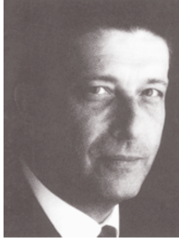
Imatge d'arxiu de Mayor Zaragoza.

F ederico Mayor Zaragoza, director general de la UNESCO entre 1987 i 1999, i Bartomeu Muñoz, alcalde de Santa Coloma, protagonitzaran l'acte central de les Jornades per la Pau i la Cooperació, que tindran lloc a la ciutat durant la segona quinzena d'octubre. Mayor Zaragoza pronunciarà una conferència sobre el tema "Cap a una cultura de pau" el dia 17 (19.30) a l'Auditori. Aquest serà l'acte més destacat d'unes jornades que pretenen mostrar les línies de la política municipal en matèria de cooperació i solidaritat. Línies que es resumeixen en tres objectius: promoure una cooperació descentralitzada de qualitat, impulsar la sensibilització vers la promoció de la pau i els drets humans en l'àmbit de ciutat i fomentar els projectes de cooperació liderats pels joves. En els propers números informarem de les activitats de les Jornades. El primer acte tindrà lloc el dia 15 (20.00) a la Biblioteca Central, organitzat per Gramenet Imatge Solidà-