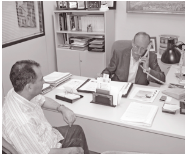
El defensor de la Ciudadanía, Fernando Oteros, en su despacho oficial.

En el discurso de presentación del Informe a los miembros del Pleno el señor Oteros destacó los principales puntos que aparecen en su informe, señalando algunas de las dificultades