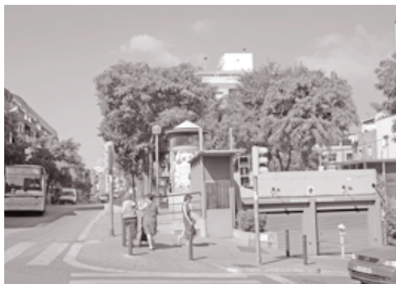
Arriba, imagen virtual del aparcamiento robotizado de la Torre Balldovina; abajo, el parking Banús, se ampliará desde la calle de Roselles hasta Àngel Guimerà

sión de más de tres millones de euros. El proyecto básico de este aparcamiento fue aprobado en la Junta de Govern Local del pasado martes, y se prevé que pueda entrar en funcionamiento en di-