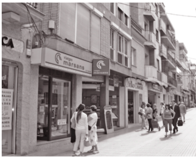
La calle de Sant Josep, en pleno centro de la ciudad.

Una parte importante de las intervenciones es la que hace referencia a la mejora del espacio inmediato de las personas, con la reurbanización de las calles de Balldovina, Sant Josep, Cultura, Sant Ramon, Sant Joaquim (entre Santa Rosa y el pa-