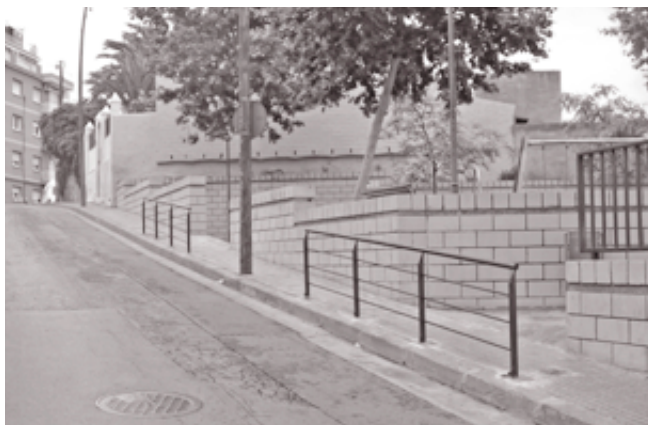
A petició de l'Associació de Veïns de Riera Alta i d'alguns usuaris s'han instal·lat, amb els Plans d'Ocupació, dues baranes de protecció al parc de la Pau.

Parles habitualment català? Vols ajudar els alumnes dels cursos de català de L'Heura que, un cop acabat el curs, volen aprofitar els mesos de juny i juliol per perdre la vergonya a l'hora de parlar en català al carrer? Truca'ns al 93 385 14 61 o registra't com a voluntari/voluntària a través de la pàgina www.vxl.cat i et posarem en contacte amb una persona aprenenta, perquè us trobeu una hora i mitja a la setmana durant set setmanes seguides. Participa-hi!