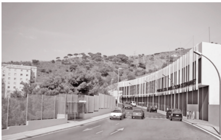
Imagen virtual de una de las opciones de actuación que se llevarán a cabo en el barrio de Les Oliveres.

El núcleo edificado principal de esta intervención en el barrio de Les Oliveres corresponde a la nueva comisaría de la Policía Local. Se trata de un inmueble con una superficie total de 4.219 metros cua-