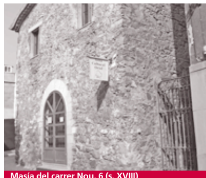
Masía del carrer Nou, 6 (s. XVIII)