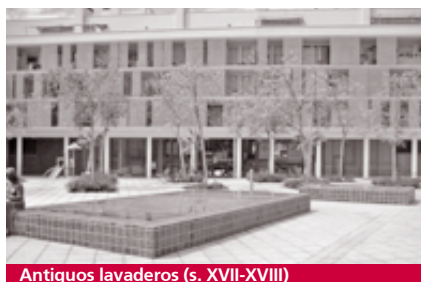
Antiguos lavaderos (s. XVII-XVIII)