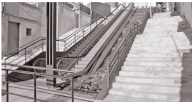
Escaleras mecánicas de la calle de Ángel Prats

E l Ayuntamiento ha iniciado las obras para la instalación de tres nuevas escaleras mecánicas en el barrio de Singuerlín, en el tramo que comunica la calle de Sants con la calle de Montseny, y que supondrán una continuación de la escalera mecánica que ya funciona en la calle de Ángel Prats.