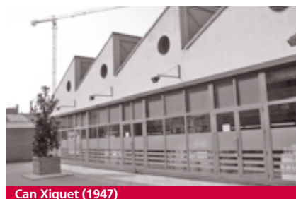
Can Xiquet (1947)