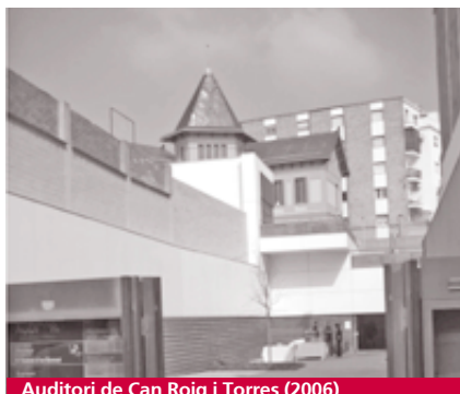
Auditori de Can Roig i Torres (2006)

Tanatori de Torribera (1927-1936). Forma parte del conjunto de pabellones de la antigua Clínica Mental, un recinto de interés arquitectónico y paisajístico.