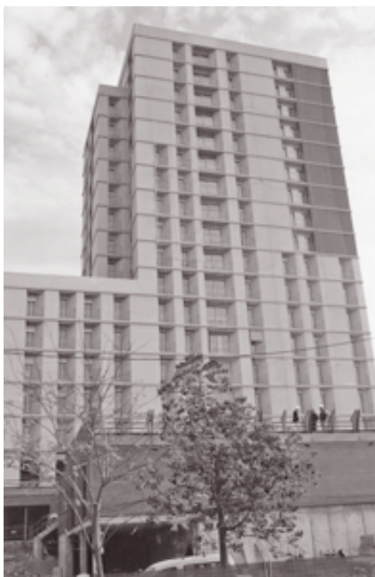
Edificio de viviendas del Front Fluvial del Besòs

Los Premis d'Habitatge Social de Catalunya 2007 han considerado como mejor actuación en vivienda de nueva construcción la promoción Alí Bei, 94-96, de Barcelona, mientras que en la categoría de actuaciones integradas se ha otorgado el primer premio a la promoción "Primera Fa-