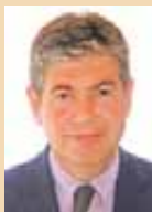
Bartomeu Muñoz i Calvet. Alcalde de Santa Coloma de Gramenet.

El desarrollo de las nuevas tecnologías de la información y de la comunicación hace posible el progreso y transformación de las relaciones entre las administraciones y los ciudadanos. Internet y el resto de plataformas y recursos digitales se han consolidado como instrumentos esenciales de información, comunicación y expresión. El portal web de nuestro Ayuntamiento ha experimentado en los últimos meses una evolución significativa tanto en su diseño como en sus contenidos. Con la intención de convertirlo en uno de los medios más eficaces de comunicación entre los colomenses y su ciudad, ampliamos día a día sus recursos y contenidos. La aplicación de dispositivos para una correcta accesibilidad de personas con déficits visuales o la disponibilidad de un buen número de trámites administrativos en línea son algunos de estos recursos; mientras que la información puntual de lo más importante de los servicios y de la actividad municipal pretende que los contenidos sean útiles para el conjunto de los visitantes de la web. Estamos trabajando para seguir dando nuevas prestaciones y por lo más amplia implantación de las nuevas tecnologías en nuestra ciudad.