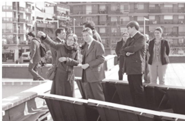
El alcalde comprobó la calidad de la instalación en el tejado del CEIP Sagarra en una visita reciente.

La implantación de placas de aprovechamiento de la energía solar para producir tanto electricidad (placas fotovoltaicas) como agua caliente (placas térmicas) es una de las estrategias del Plan de Acción Ambiental Agenda 21 Local, cuyo objetivo es conseguir un modelo de consumo energético sostenible.