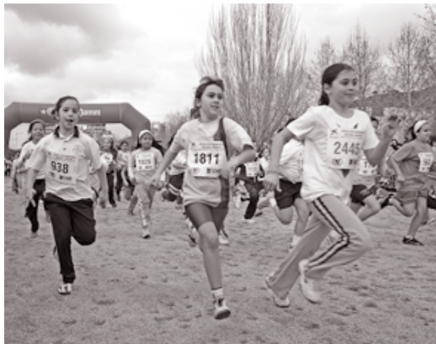
Els escolars tindran un protagonisme especial el proper diurne al parc de Can Zam.