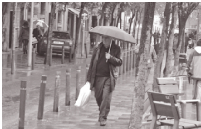
Imágenes como ésta han sido poco frecuentes en los últimos meses en nuestra ciudad.

—No se llenarán las piscinas públicas. Únicamente se autoriza la recuperación de las pérdidas por evapo-