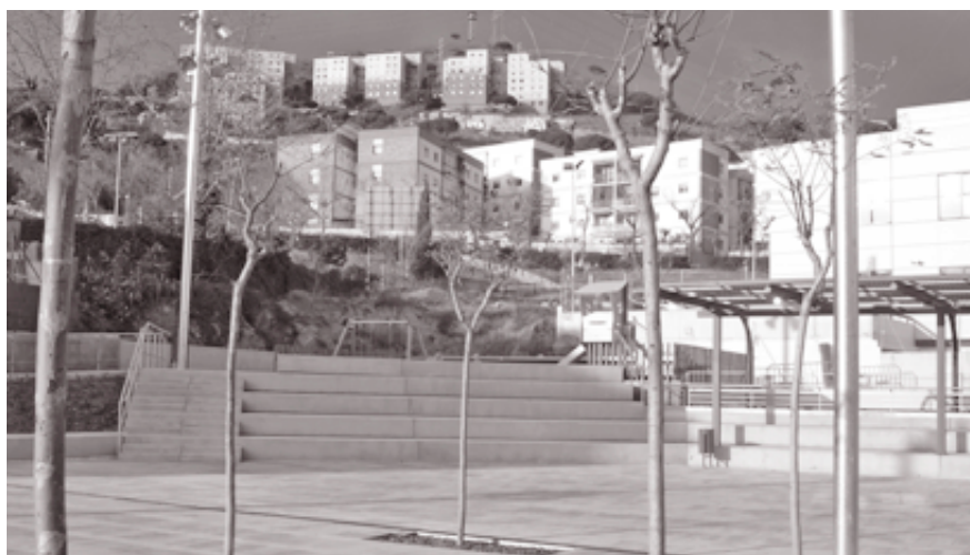
La plaza de Josep Tarradellas, en el barrio de La Guinardera, poco antes de su inauguración.

La fiesta de inauguración comenzará en las pistas de minitenis con diversas actividades lúdicas dirigidas por monitores especializados. A las 12.00 del mediodía desfilará un colorista pasacalle de la Colla de Gegants i Capgrossos, desde la plaza de la Sagrada Família hasta el nuevo enclave de la Guinardera. Finalmente, a las 12.30 el grupo Xip Xap animará la fiesta con mucha música, baile y juegos. La plaza que lleva el nombre del ex presidente de la Generalitat tiene una superficie de 3.326 me-