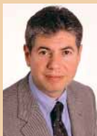
Bartomeu Muñoz i Calvet , Alcalde de Santa Coloma de Gramenet.

Els serveis socio-sanitaris suposen un nucli fonamental de prestacions per assegurar la qualitat de vida de les persones, entesa de manera integral. Són serveis que incideixen no tant sols en la atenció de qui presenta una necessitat específica, sinó que dona suport a tot l'entorn familiar, millorant-ne, així, les condicions de vida. És per això que les administracions no podem renunciar a impulsar de forma continuada la millora d'aquests recursos, amb noves prestacions, amb proximitat i amb el nivell professional que garanteixi l'atenció sanitària i l'atenció social a tots els ciutadans.