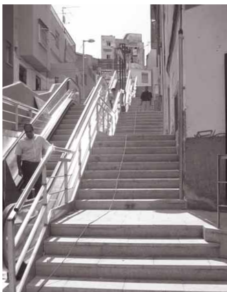
Imagen, días antes del final de las obras, de las escaleras mecánicas y de obra de la calle del Bruc.

L a puesta en marcha el miércoles día 12 de septiembre (19 horas) de las dos escaleras mecánicas instaladas en el tramo final de la calle del Bruc, para hacer más cómodo el paso de los peatones en el espacio con un desnivel de nueve metros que hay entre las calles de Mas Marí y Sant Pasqual, es la primera de las diversas actuaciones que contempla el proyecto Eix Bruc. Se trata éste de un conjunto de obras enmarcadas en el proceso de intervención integral de reforma que se está llevando a cabo en los siete barrios de la Serra d'en Mena, que comparten Santa Coloma y Badalona, con la ayuda económica de la Llei de Barris de la Generalitat, y que incluye otras actuaciones de gran importancia que posibilitarán la mejora de los barrios del Fondo, Santa Rosa, Raval y Salfareigs. La instalación de las escaleras me-