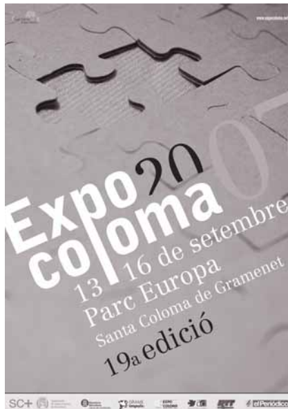
La Expocoloma llega a su 19ª edición con un prestigio consolidado y un gran poder de convocatoria.

La organización espera superar la cifra de 250.000 visitantes e incrementar el número de