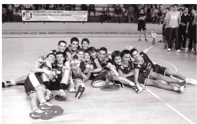
El Caja San Fernando de Sevilla, després de proclamar-se campió en l'edició de l'any passat.

La asociación Saucha ha abierto dos grupos de yoga en el Centre Cívic del Raval (Monturiol, 20). Las clases comenzarán el día 17 y se impartirán los lunes de 17.30 a 19.15 y de 19.30 a 21.15 h. Más información, en el tel. 93 313 12 10.