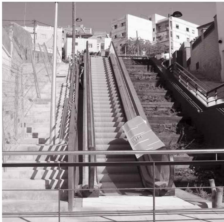
En la calle de Àngel Prats se ultiman los preparativos para la puesta en marcha de las escaleras mecánicas.

El Plan de Mejora de la Movilidad continúa extendiéndose a otros lugares de la ciudad, donde la orografía del terreno supone un problema para los peatones. En este momento se construyen dos escaleras mecánicas en la calle del Bruc, dos más en la calle de Génova y dos también en la calle dels Alps, así como dos nuevas rampas mecánicas en la calle de Aragón. Todas estas obras está previsto que finalicen en un plazo de