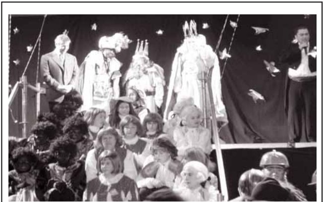
LES FESTES D'HIVERN S'ACOMIADEN AMB UNA GRAN CAVALCADA DE REIS. La cavalcada de Reis, que tradicionalment acomiada les Festes d'Hivern, ha estat una de les més participatives, espectaculars i coloristes dels darrers anys. La cavalcada va travessar gairebé tota la ciutat, despertant una gran expectació entre els més petits. Com a anècdota, assenyalar que una dona es va posar de part al barri del Fondo al pas dels mags d'Orient.

Más información, en el teléfono 902 18 06 40 y en Internet, en la página www.na-esp.org .