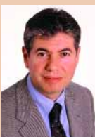
Bartomeu Muñoz i Calvet. Alcalde de Santa Coloma de Gramenet.

Amb la primavera, a Santa Coloma torna la bona literatura. Un cop més, des de l'Ajuntament, comptant amb la col·laboració, la creativitat i la implicació de les entitats ciutadanes dedicades al món de les lletres, us oferim una programació diversa i de qualitat durant dos mesos. La culminació d'aquesta Primavera Literària arribarà el 23 d'abril, quan la Diada de Sant Jordi la lletra impresa i les flors envaeixin de nou els carrers de la nostra ciutat per celebrar un llegat valuós de la nostra cultura. Gaudiu d'aquesta proposta cultural i de ciutat, a la primavera, de la mà d'un bon amic de tothom: el llibre.