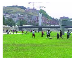
La presencia de aves acuáticas en el Besòs es un fenómeno habitual, como se aprecia en la foto superior. En la parte inferior, la placa fotovoltaica de la Biblioteca Central, los aspersores que riegan el parque con aguas freáticas y un grupo de personas en el césped del parque fluvial.

en marcha otras propuestas innovadoras en el ámbito de la energía. En el verano de 2005, Santa Coloma se incorporó a la Red de Ciudades Españolas por el Clima, y dispone de una ordenanza solar térmica. Desde hace un año, todos los edificios nuevos que se construyen en el término municipal colomense cuen-