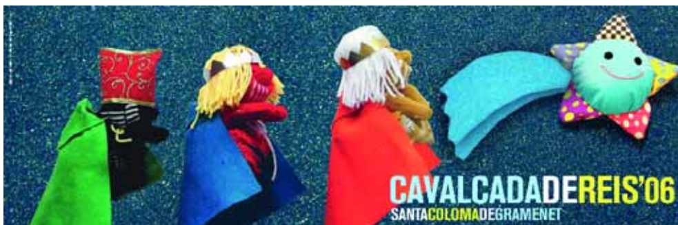
Cartell de la cavalcada. Disseny: Jordi Abad i Georgina Durán (per a Manuel Reyes).

Els Reis arribaran en helicòpter a les 17 hores a les pistes d'atletisme, i prèviament, allà mateix, tots els i