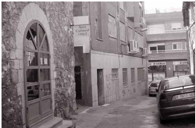
La calle Nou, una de las más antiguas de la ciudad.

Antes de llevar a cabo el proyecto, se desea recabar la opinión vecinal sobre la necesidad del aparcamiento en la zona. Las personas interesadas deberán presentar su solicitud acompañada de fotocopia del DNI, y hacer un depósito de 300,00 €, en las oficinas de Gramepark, situadas en la rambla del Fondo, 13. El plazo de presentación de solicitudes será desde el 21 de noviembre hasta el 30 de diciembre a las 14 h. Las plazas de aparcamiento se adjudicarán por sorteo y se podrá solicitar una plaza por persona.