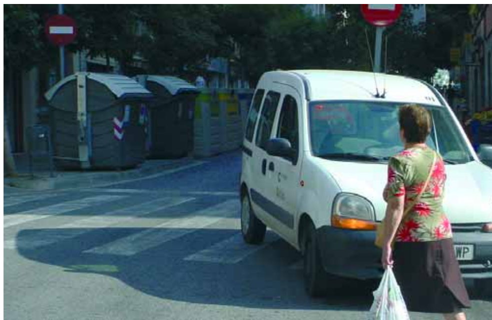
Vehículo del servicio de inspección de la limpieza viaria.