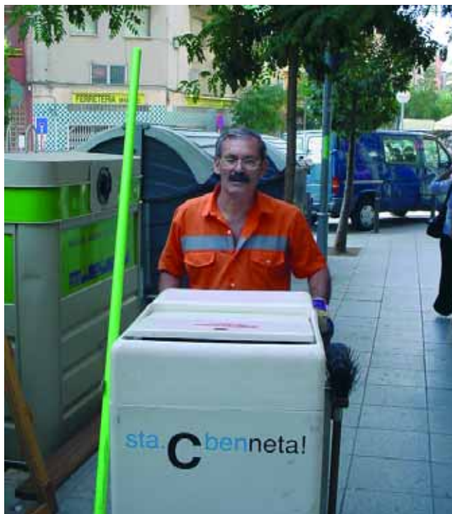
Un operario realizando el servicio de barrido en la calle de Sicilia.

destinado a este fin. Las calles de Santa Coloma contarán con más personal, lo que permitirá aumentar la frecuencia semanal de barrido.