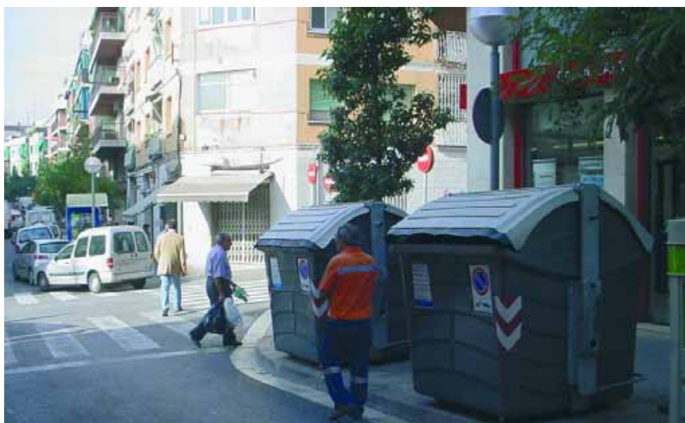
El servicio contempla también los desbordes en los contenedores de basura.

A partir de ahora, la limpieza durante el fin de semana, que se hacía en 10 zonas concretas de Santa Coloma de Gramenet, se extiende a otras 10 nuevas zonas, además de incluir un servicio de repaso por las tardes en zonas comerciales. También se va a poner en marcha un servicio de baldeo intensivo de do-