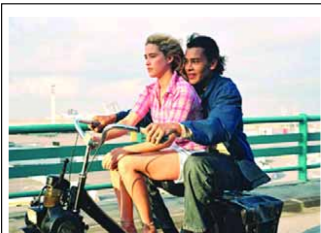
Vuelve el cine al Sagarra. Con la película francesa Lila dice , se reinicia hoy día 30 (22 h.) la programación habitual de cine en el Teatre Sagarra. Lila dice (2004) está dirigida por Ziad Doueiri y cuenta la historia de un primer amor entre una chica soñadora y un joven árabe.