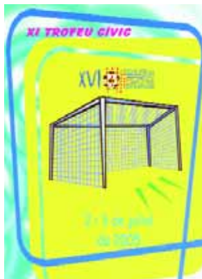
torneig 3 x 3, les proves d'habilitat (futbolmania) i el futvolei.

Els dies 2 i 3 de juliol tindrà lloc al Complex Esportiu Torribera el Trofeu de Futbol Sala que organitza l'FS Ràpid Santa Coloma. Hi participaran diversos equips de les categories prebenjamí, benjamí, aleví, infantil, cadet i juvenil. Formaran dos grups, competiran a través del sistema de lligueta i els classificats en primer lloc accediran a la final. Els partits començaran dissabte a les 10 h i es jugaran de manera ininterrompuda. El lliurament de trofeus està previst per a diumenge a la tarda (20 h). Hi haurà, a més, altres activitats lúdiques vinculades al trofeu, com el