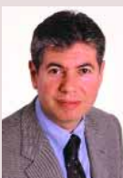
Bartomeu Muñoz i Calvet. Alcalde de Santa Coloma de Gramenet.