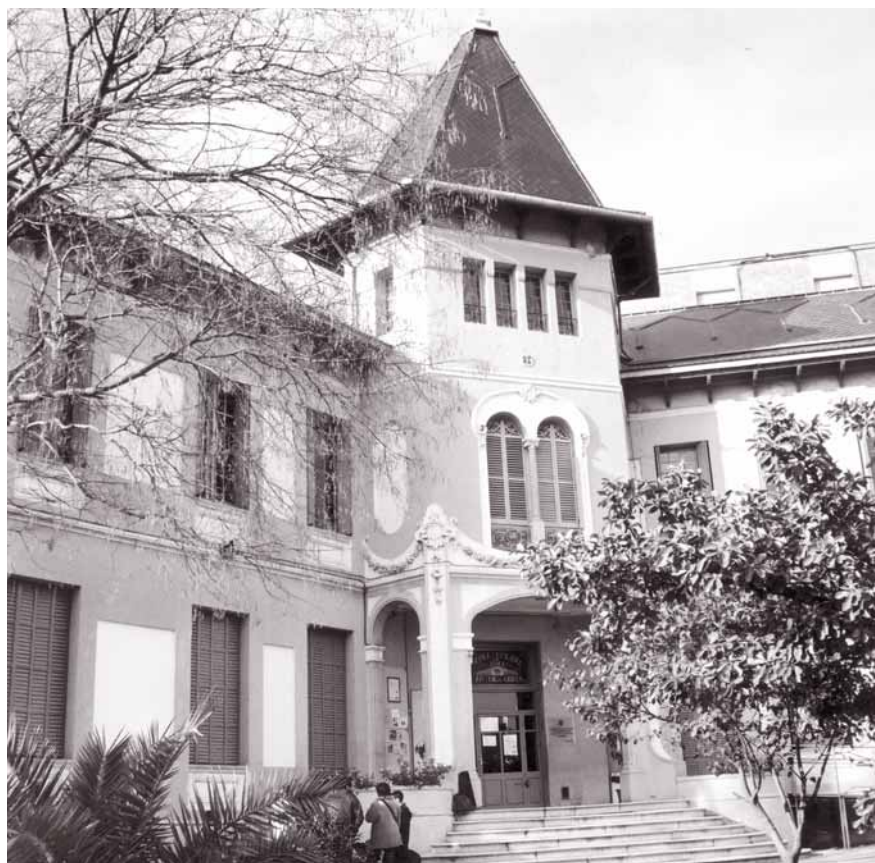
L'edifici de Can Roig i Torres també es beneficiarà d'obres de reforma.

Fa dues dècades que l'Escola Municipal de Música ocupa l'edifici històric de Can Roig i Torres. A partir de 2007 la ciutat comptarà amb un nou equipament cultural, un auditori amb capacitat