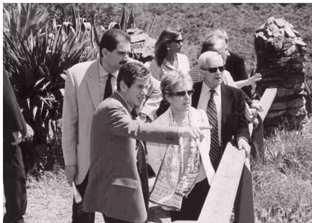
El alcalde, la consellera i diversos regidors en la visita al poblat ibèric.

Prèviament, la consellera i l'alcalde van visitar el parc arqueològic i el poblat ibèric Puig Castellar, on aquests dies se celebra el programa d'activitats de la octava festa ibèrica, i van inaugurar en el museu dues exposicions. Per una part, la segona fase de la ex-