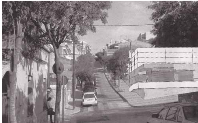
Imatge virtual del nou pavelló esportiu.

La Coordinadora de Dones pone en marcha un servicio de atención personalizada (martes de 18 a 20 h), en el Centre Cívic del Riu (Pompeu Fabra, 22-24; tel. 93 391 51 79).