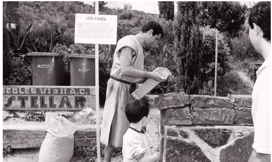
Una imatge de la Festa Ibera de l'any passat.

El poblat ibèric està situat a la serralada de Marina, a la part alta del turó del Pollo, i té una extensió d'uns 5.000 m 2 . Va ser descobert l'any 1902 per mossèn Palà. Les primeres excavacions les va duu a terme Ferran de Sagarra i Siscar, propietari dels terrenys. L'any 1919 els va donar a l'Institut d'Estudis Catalans, que va continuar amb la tasca arqueològica. El 1954, el Centre Excursionista Puigcastellar va reprendre les excavacions. L'any 1997, el Museu Torre Balldovina va iniciar noves actuacions: es van condicionar l'entorn i els accessos i es va fer una adequació didàctica del poblat. El 2002, any de celebració del centenari de la descoberta, les institucions van donar un fort impuls a la divulgació del poblat amb la creació del parc arqueològic Puig Castellar.