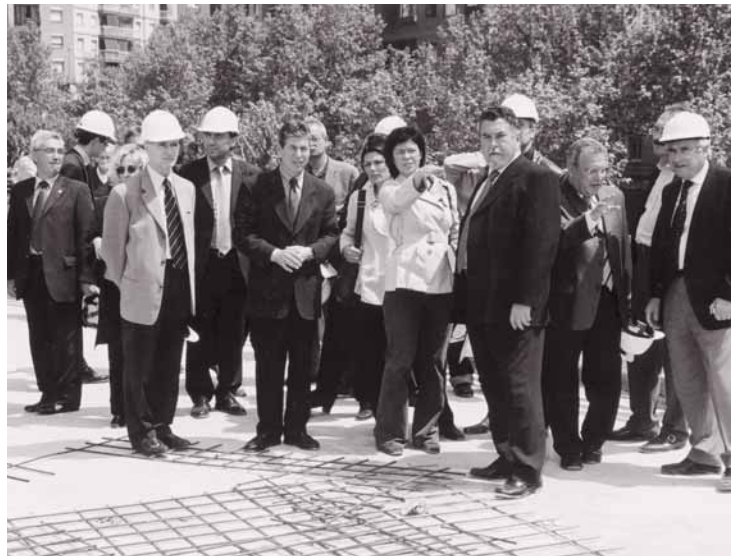
El alcalde, junto a técnicos y autoridades municipales, en la visita a las obras de la plaza del Fondo.

El alcalde visitó el pasado viernes las obras de la plaza y del centro deportivo, acompañado por los responsables de la empresa municipal Gramepark, encargada del proyecto, y por el personal