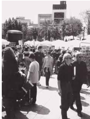
10.30 h, els centres Jaume Salvatella i Lluís Millet oferiran exhibicions d'a-

Des de bon matí es podrà visitar els diferents estands dels centres educatius públics i les entitats a la plaça de la Vila, i es mostraran exposicions de treballs i es faran diferents jocs. Per a les 12 hores està prevista una cercavila, amb la participació de les colles de gegants i capgrossos i de grallers i l'associació Arrels de Barri. Can Sisteré acollirà actuacions musicals de l'escola Musicaula (10 h) i de l'Escola Municipal de Música Can Roig i Torres (12.30 h) i un fragment d'una obra de teatre a càrrec del CEIP Pallaresa. D'altra banda, al poliesportiu de Can Sisteré, a partir de les