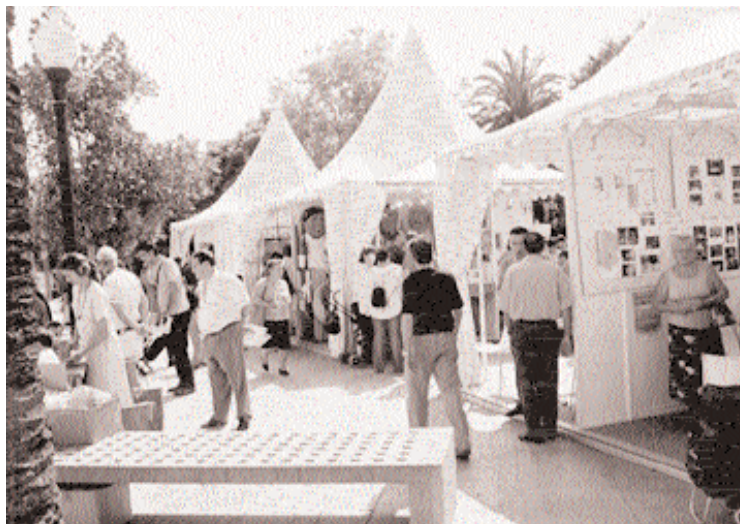
Sobre aquestes línies, una instantània de la I Mostra d'Entitats, celebrada l'any passat a la plaça de la Vila; a sota, el cartell anunciador de la segona edició.

El grup de pop rock Irakunda, una de les revelacions del Cortocircuit d'enguany,