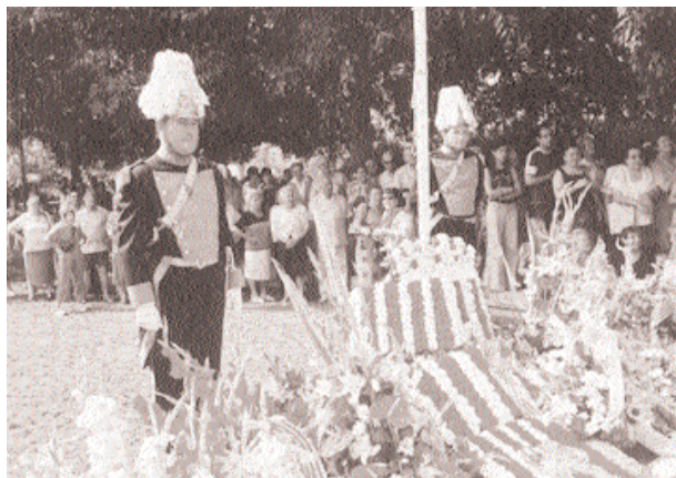
Ofrena floral. Un total de 63 entitats (institucions, associacions cíviques, socials i culturals, etc.) van participar l'Onze de Setembre en la tradicional ofrena floral a la senyera a la plaça de la Vila. L'acte va ser presidit per l'alcalde, els regidors i les regidores i es va desenvolupar en un clima de solemnitat.

■ CEIP Wagner: protecció del perfil de les escales.