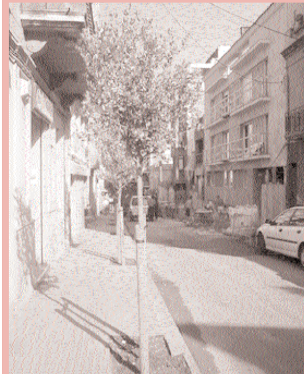
Plantació d'arbres al carrer de Rafael Casanova. El passat 28 de juny es va iniciar la plantació d'arbres al carrer de Rafael Casanova. Degut al deteriorament dels acer negundo que hi havia, s'ha decidit la seva substitució per una nova espècie, la fejjoa sellowiana . Aquesta espècie, nova a Santa Coloma, es caracteritza principalment pel seu port petit, molt adequat per als carrers estrets de la nostra ciutat, per la seva fulla persistent i la seva vistosa floració.

Les persones que viatgin amb una mascota durant les properes vacances han de pensar que igual que nosaltres portem el DNI o el pasaport, ella també necessita portar els seus papers acreditatius: la cartilla sanitària i la identificació de l'animal en funció de la seva raça (en cas que encara no la tingui, ara és el moment de fer-la, ja que si l'animal s'extravia és la millor opció per recuperar-lo). Portar-lo de vacances només és qüestió d'organitzar-se. Per a més informació, cal trucar al Departament de Protecció dels Animals (93 462 00 00 ext. 4055) o a l'Oficina d'Informació d'Atenció Ciutadana (93 462 40 40).