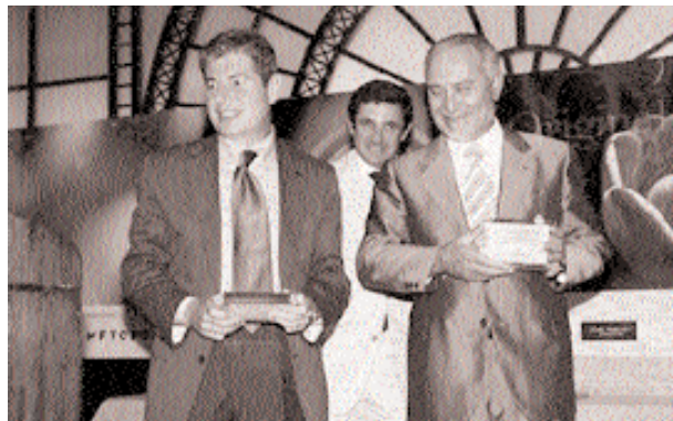
Los alcaldes de Santa Coloma y Móstoles, en el momento de recibir el premio contra la piratería.

El jurado estaba compuesto por diez representantes de empresas e instituciones: AEDPI, Universidad de Derecho Penal, BSA, Editorial Jurídica El Derecho, Clarke & Modet C, Aisge Computing, la Brigada de Investigación de la Policía y la empresa Método 3.