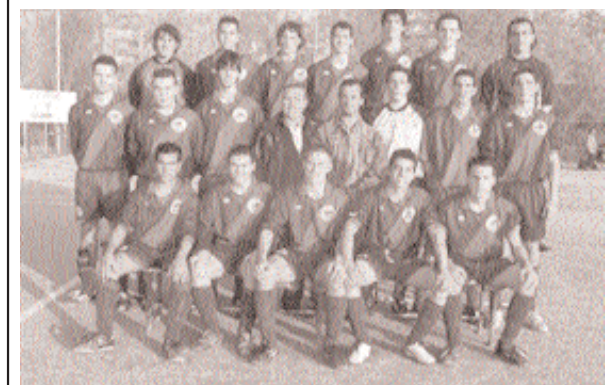
Éxitos de las categorías inferiores del CD Arrabal. Los equipos Infantil y juvenil del CD Arrabal se han proclamado campeones de liga y han ascendido a la Primera División de sus respectivas categorías.