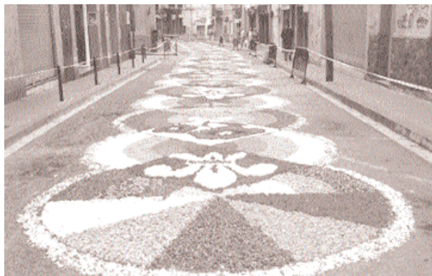
Catifes florals. El Centre Comercial Sant Jeroni tornarà a fer les espectaculars catifes florals als carrers de Sant Jeroni i Santa Coloma el dia 13.

E a UNED de Santa Coloma obre el termini de preinscripció i de matrícula per al proper curs. Els estudis que la UNED oferirà el pròxim curs seran: llicenciatura en dret (pla nou i antic) i en psicologia (pla nou i antic); diplomatura en educació social (pla nou); llicenciatura de 2n cicle en psicopedagogia, i llicenciatura de 2n cicle en antropologia social i cultural, que ja es podran estudiar totalment a Santa Coloma. També es pot estudiar el curs d'accés per a majors de 25 anys. La sol·licitud d'admissió es pot presentar del 16 de juny al 31 de juliol, l'han de demanar les persones que hagin de fer trasllat d'expedient o simultaneïtat d'estudis. La matrícula es farà en dos terminis: el primer, del 15 al 30 de juliol, per a alumnes nous que no hagin de demanar admissió i alumnes de la UNED que no estiguin pendents de qualificacions. El segon termini, del 15 de setembre al 15 de novembre de 2004, s'obrirà per a tots els alumnes. L'horari d'atenció al públic durant els mesos d'estiu (del 14 de juny a l'1 d'octubre) serà de dilluns a divendres de 9 a 14 i dimecres de 16.30 a 19.30 h.