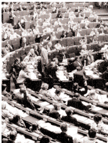
con total normalidad. Los electores de los 25 estados miembros

En nuestra ciudad están llamados a las urnas un total de 89.153 personas mayores de 18 años, que podrán votar a cualquiera de las 31 candidaturas que se presentan. Santa Coloma contará con 157 mesas. Todos los servicios de seguridad y de información relacionados con estos comicios están ya cuidadosamente organizados para que la jornada se desarrolle