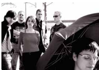
Irakunda i El Faro de Virginia són els grups colomencs que participen aquest any.

seleccionen dos grups per municipi d'entre tots els aspirants, no hi ha un guanyador. Aquest cicle garanteix als grups la participació en almenys quatre concerts. L'entrada és gratuïta i els grups no cobren per les actuacions. L'organització proporciona formació, difusió i suport, però no diners als grups.