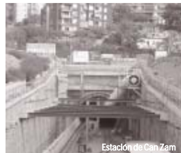
Estación de Can Zam

La línea 9 tendrá seis estaciones en nuestra ciudad. Can Zam, Singuerlín, Plaça de l'Església, Fondo (enlace con la Línea 1), Santa Rosa y Can Peixauet. Exceptuando la de Santa Rosa, las estaciones se encuentran muy avanzadas. Los operarios construyen los pozos y accesos desde la calle a los vestíbulos y los andenes. El andén de cada parada se realiza en el proceso de excavación de la tuneladora. Los trabajos para la estación de Santa Rosa se iniciarán tras la reubi-