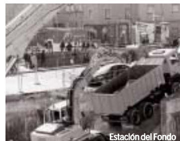
Estación del Fondo