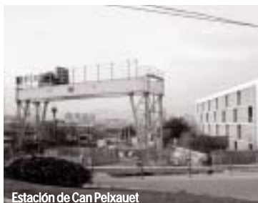
Estación de Can Peixauet

El primer tramo de la línea 9 de metro, con seis estaciones en Santa Coloma, podría entrar en servicio el próximo año, según las previsiones del Departament de Política Territorial i Obres Públiques de la Generalitat. Actualmente la tuneladora ya ha perforado más de 1.500 metros del subsuelo de la ciudad, al tiempo que se construyen las estaciones. La que será la línea más larga de Europa unirá Badalona y Santa Coloma con la Zona Franca y el aeropuerto de El Prat. La ejecución de las obras se ha dividido en cuatro tramos. El primero, que consta de dos ramales, conectará Can Zam y El Gorg en Badalona con la estación de la Sagrera en Barcelona. La tuneladora, que entró en funcionamiento a finales de junio del año pasado, ha recorrido ya 1.544 metros desde el origen en Can Zam. Actualmente se encuentra entre las estaciones de Singuerlín y Plaça de l'Església. Este gigantesco artefacto avanza a una velocidad media de 10 metros por día, permitiendo la excavación y el revestimiento del túnel a la vez.