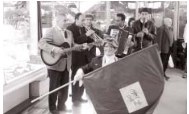
El Capitán Compost, en plena actuación en el mercado de Singuerlín.

A principios de mes el Ayuntamiento inició una campaña informativa para dar a conocer la recogida selectiva de la fracción orgánica entre los grandes productores. En este tiempo se ha insistido en la importancia de la colaboración de las empresas para la mejora medioambiental, seleccionando los productos de materia orgánica (resto de comida y vegetales) de sus establecimientos. La recogida de los residuos orgánicos se realiza diariamente, de lunes a sábado, para llevarlos a la planta Ecoparc de Montcada i