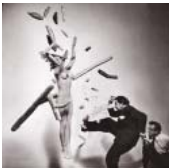
La primera sortida serà al centre CaixaFòrum per veure la mostra "Dali. Cultura de masses".

E l Museu Torre Balldovina reprèn el Programa de sortides culturals dels diumenges amb noves propostes de visites guiades per conèixer el patrimoni històric, cultural i natural. La primera serà una matinal, que tindrà lloc el 22 de febrer, per visitar el conjunt monumental de la fàbrica Casarramona, que actualment acull el centre cultural CaixaFòrum, i veure la col·lecció d'art contemporani i l'exposició "Dali. Cultura de masses", emmarcada en els actes de celebració de l'Any Dalí. També es visitarà el pavelló Mies van der Rohe, el pavelló d'Alemanya de l'Exposició Internacional de 1929 de Barcelona. A continuació hi ha previstes tres sortides d'un dia: a les coves prehistòriques de Serinyà i a Banyoles (març), als museus del Transport i del Ciment Asland de Castellar de n'Hug i a les fonts del Llobregat (abril) i a la fortalesa ibèrica els Vilars d'Arbeca i al Parc Temàtic de l'Oli de les Borges Blanques (maig). El primer semestre finalitzarà amb una sortida de quatre dies a València (juny) per conèixer aquesta ciutat, el seu