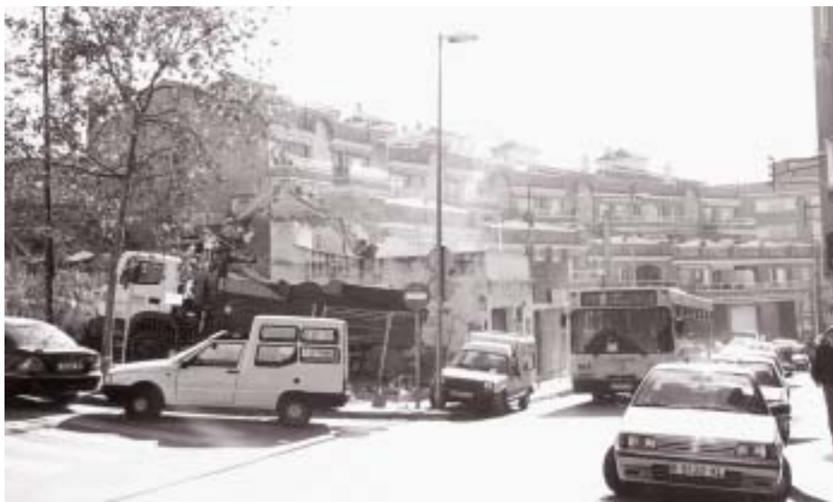
Imagen de las obras de derribo que se han llevado a cabo recientemente en la avenida de Catalunya.

El Ayuntamiento se propone construir 600 pisos en este mandato