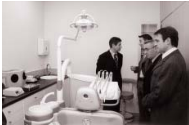
El alcalde y el presidente del IME visitaron las instalaciones del CER, acompañados por el director del centro y el responsable del nuevo servicio médico.

tá prevista la creación de un solarium en uno de los espacios adyacentes al centro.