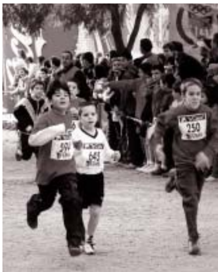
Els Guardons de l'Esport Colomenc tenen com a finalitat afavorir la pràctica esportiva a la ciutat des de la base.

Per la seva tasca de difusió de l'esport i la