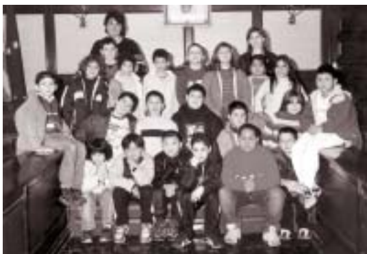
CEIP Sant Just. Els alumnes de 3r de primària de l'escola Sant Just van visitar l'Ajuntament el 12 de novembre. Aquesta visita forma part del Programa d'activitats educatives.