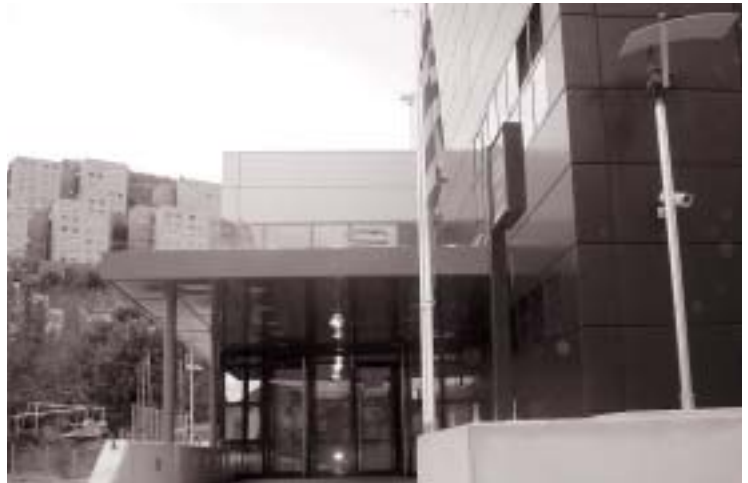
El sábado será una jornada de puertas abiertas: los ciudadanos podrán visitar la comisaría hasta las 18 h.

La dotación policial está repartida en estas áreas: la Unidad de Seguridad Ciudadana, que integra las patrullas y servicios diarios; la Oficina de Atención al Ciudadano (OAC), donde se recogen las denuncias; la Oficina de Atención a la Víctima, en la que hay agentes femeninas especializadas en violencia doméstica; la Oficina de Relaciones