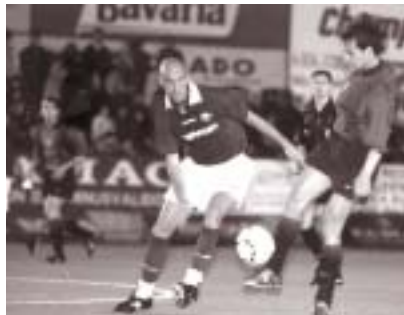
El Barça y la Grama ya jugaron en la Copa de Catalunya.

E l partido correspondiente a la primera eliminatoria de la Copa del Rey de fútbol, que enfrentará en el Nou Camp Municipal a la UDA Gramenet y al FC Barcelona, ha levantado una gran expectación. El encuentro se disputará el 7 de octubre (TV3, 21.15 h.) y las entradas están a la venta, desde hace unos días, en las oficinas del club colomense (plaça d'en Vilaseca,