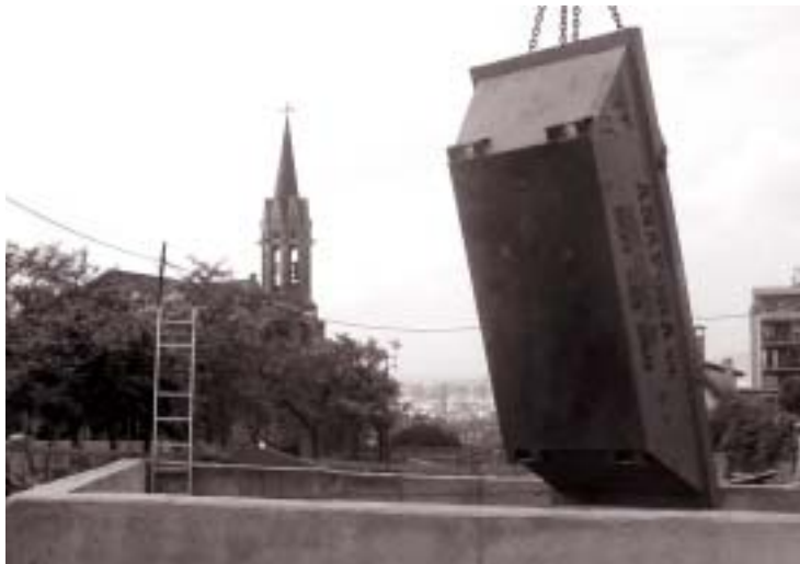
Instantánea de las obras de la estación Plaça de l'Església, una de las seis paradas que tendrá la L9 en la ciudad.

Las obras de construcción de la línea 9 de metro en Santa Coloma de Gramenet, que ejecuta la Generalitat, se desarrollan a buen ritmo. Mientras la tuneladora avanza por el subsuelo, cinco de las seis estaciones que tendrá la línea en nuestra ciudad se encuentran en plena fase de construcción. Las obras en Santa Rosa serán las últimas en comenzar, a la espera de la reubicación de las familias afectadas