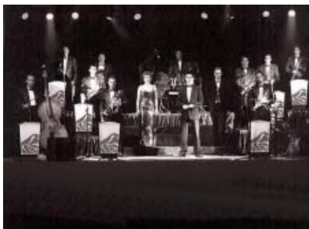
La Cabra Mecànica i l'orquestra Rosaleda són alguns dels atractius musicals de la Festa.

de la Vila. Organització: secció d'escacs La Colmena.