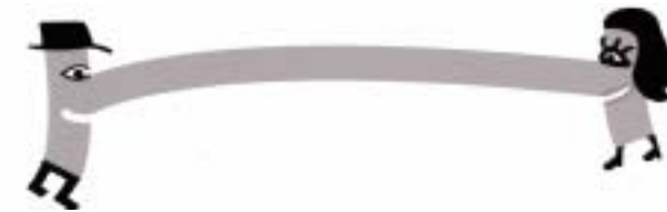
Mascota de la L9, dissenyada per Gorka Alzpurúa, estudiant de l'escola Eina.

El dia 28, a partir de les 9 h i al llarg de tota la jornada, es jugarà al pavelló del Raval el VIè torneig de futbol sala femení Ciutat de Santa Coloma, que organitza el Que's Lider Santa Coloma FSC. A més del club colomenc, hi participen els equips Pony's FS, Castelldefels (A i B), P. Blaugrana Nou Rambla, AEJ Riera Cornellà i La Llagosta. Els partits tindran una durada de 40 minuts.