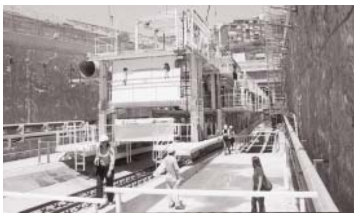
En la foto de arriba, el conseller en cap, el conseller de Política Territorial y el alcalde accionan el mecanismo que pone en marcha la tuneladora. Sobre estas líneas, una instantánea de esta moderna máquina.

ríos, el Besòs y el Llobregat. La tecnología de la tuneladora permite que ésta excave y revista el túnel al mismo tiempo. Tiene un diámetro de excavación de casi doce metros y una longitud de 130 metros. El avance de perforación previsto es de 5 a 10 metros diarios y trabajará las veinticuatro horas. Mientras una rueda frontal gira, el material que extrae sale al exterior mediante una cinta transportadora. A medida que va avanzando, la tuneladora co-