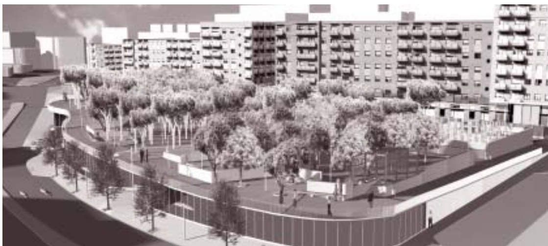
Imagen virtual de la que será la nueva plaza del Fondo. Se observan dos sectores diferenciados, por la división que establece la calle de Verdi, que en su extremo sur estará cubierta por un puente para paseantes, lo que dará continuidad a la plaza.

Todas las obras previstas en la zona finalizarán a primeros de 2005