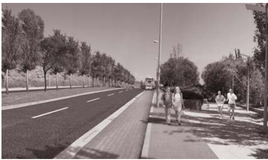
Recreació informàtica de la futura avenida de Mn. Pons i Rabadà.