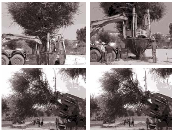
Les imatges recullen diversos moments de les tasques de trasplantaments a Can Zam.

Dels 191 arbres, només el populus alba és insalvable, donades les