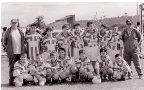
L'alevi del Singuerlin CF, campió de Lliga. L'equip alevi del Singuerlin CF ha assolit l'ascens a 1a Divisió en quedar campió de la Lliga 2001-2002. La pujada a una de les categories fortes del futbol base català és un fet important a la ciutat, ja que fins ara només la Gramenet ho havia aconseguit. Per a la propera temporada, el club fa proves a nois i noies nascuts entre 1985 i 1995 dimarts i dijous (18 h) al camp Nicolás Logarón, a Can Zam.