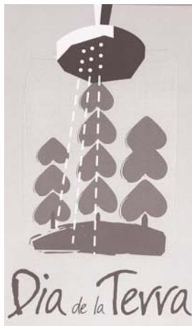
Cartell commemoratiu del Dia de la Terra a la nostra ciutat.

L'esmentada empresa ha millorat les condicions de la canalització que té el barri de les Oliveres i ha enllestit altres feines —com el recobriments de terres— per millorar l'impacte visual.