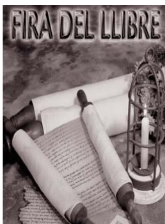
Llegenda de Sant Jordi, a càrrec del grup La Fanfarra. A més, els infants podran

Els més petits tindran un protagonisme especial per Sant Jordi. A les 12 h, hi haurà una representació de titelles, La