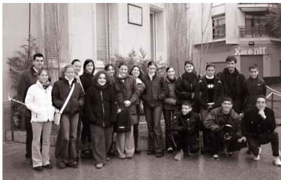
IES Ramon Berenguer. Els alumnes de 1r de batxillerat de l'IES Ramon Berenguer van visitar l'Ajuntament el passat dia 17 de desembre. Aquesta visita forma part del Programa d'activitats educatives.