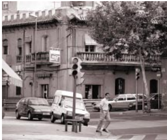
La campaña de obras va acompañada de sanciones a quienes deterioren la vía pública.

Con el mismo fin de mejorar la vía pública, la inspección municipal lleva a cabo de forma paralela una