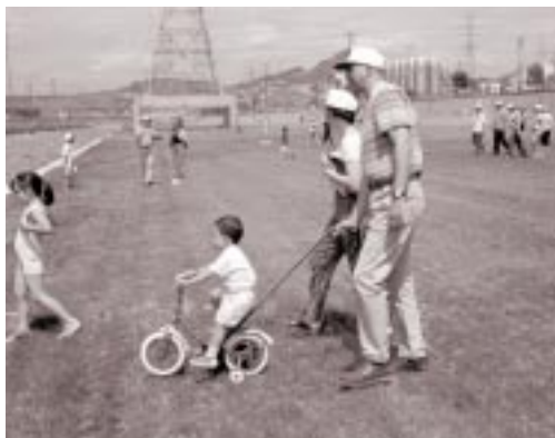
Foto del parque fluvial publicada por Joan Guerrero en su libro El río .

Desde su puesta en marcha se han logrado tres objetivos importantes: mejorar la calidad de las aguas procedentes de la planta depuradora de Montcada mediante la implantación de las zonas húmedas del parque, optimizar la capacidad