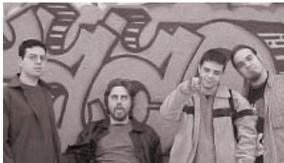
El grup de rock colomenc Sunshine participarà al Cortocircuit.