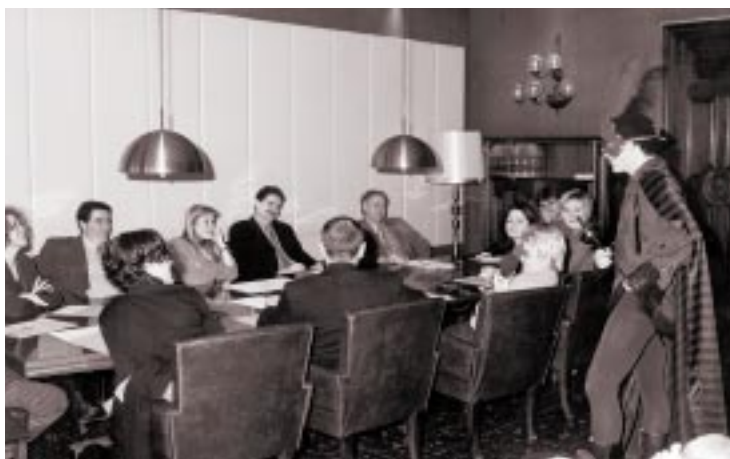
Aquesta imatge correspon a la roda de premsa de presentació de la campanya, on va fer la seva primera actuació el personatge d'en Pocabossa.

Un equip d'informadors visitarà 3.000 domicilis del centre de la ciutat