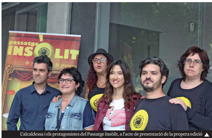
L'alcaldesa i els protagonistes del Passatge Insòlit, a l'acte de presentació de la propera edició ▲